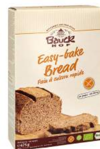
chleb ciemny bezglutenowy, bio