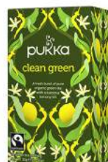
clean green 20 saszetek