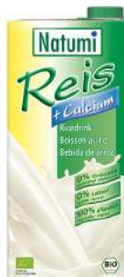
napój ryżowy z wapniem z alg morskich