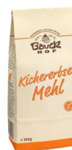
mąka z ciecierzycy bezglutenowa, bio