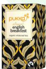
elegant english breakfast 20 saszetek