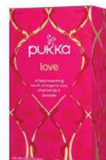
love 20 saszetek