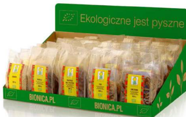
zestaw ekspozycyjny owocowy mały