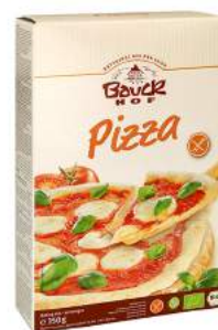
pizza bezglutenowa, bio