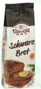
chleb ciemny bezglutenowy, bio