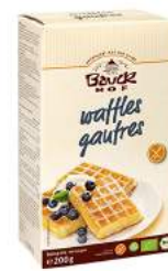
wafle, gofry bezglutenowe, bio