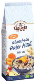
musli owsiane z owocami bezglutenowe, bio