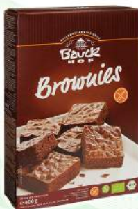
ciasto czekoladowe bezglutenowe, bio