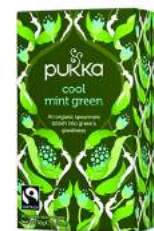
cool mint green 20 saszetek