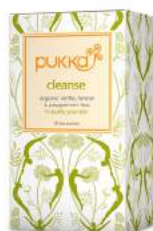
cleanse 20 saszetek