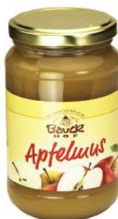
mus jabłkowy bio