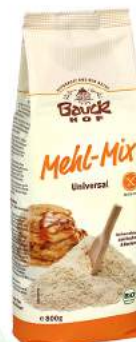
mix mąk uniwersalny bezglutenowy, bio