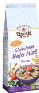
musli owsiane z owocami jagodowymi bezglutenowe, bio