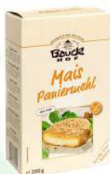
panierka kukurydziana bezglutenowa, bio