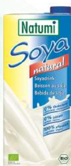
napój sojowy naturalny