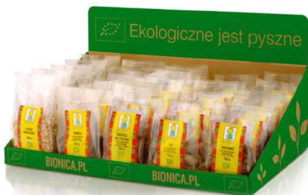
zestaw ekspozycyjny owocowy duży

Zestawy ekspozycyjne składają się z opakowania kartonowego z nadrukiem wypełnionego produktami.