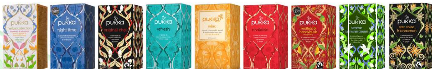
herbal collection 20 saszetek