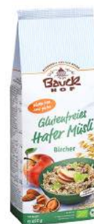
musli owsiane Bircher bezglutenowe, bio