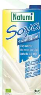
napój sojowy z wapniem