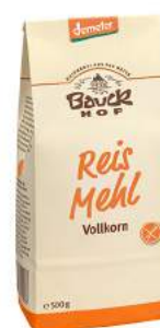
mąka ryżowa bezglutenowa, bio