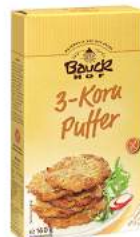
placki 3-ziarna bezglutenowe, bio