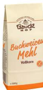
mąka gryczana bezglutenowa, bio