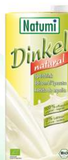
napój orkiszowy naturalny