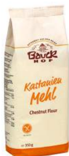
mąka kasztanowa bezglutenowa, bio