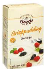
budyń bezglutenowy, bio