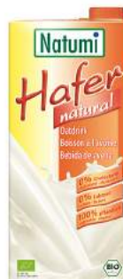
napój owsiany naturalny