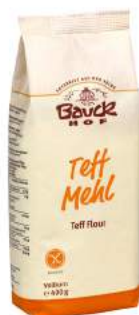
mąka teff bezglutenowa, bio