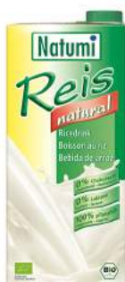
napój ryżowy naturalny