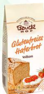
chleb owsiany bezglutenowy, bio