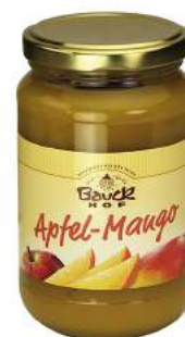
mus jabłkowo - mangowy bio