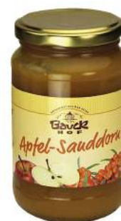
mus jabłkowo - rokitnikowy bio