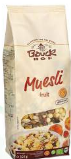
musli z kawałkami owoców bezglutenowe, bio