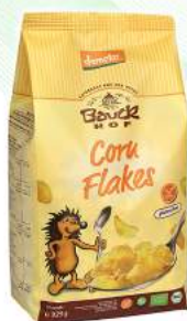
płatki kukurydziane bezglutenowe, bio