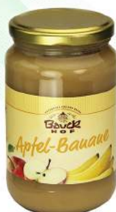
mus jabłkowo - bananowy bio