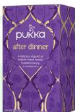
after dinner 20 saszetek