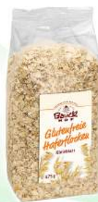
płatki owsiane bezglutenowe, bio