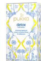
detox with lemon 20 saszetek