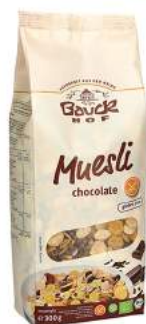
musli z czekoladą bezglutenowe, bio