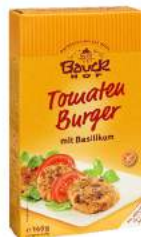
burger pomidorowy z bazylią bezglutenowy, bio