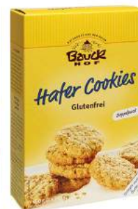
ciasteczka owsiane bezglutenowe, bio