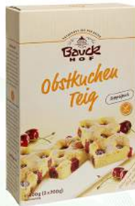
ciasto owocowe bezglutenowe, bio