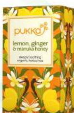
lemon, ginger & manuka honey 20 saszetek