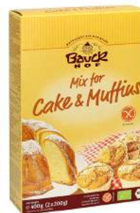
mix do wypieku ciast i babeczek bezglutenowy, bio