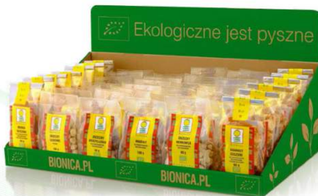
zestaw ekspozycyjny orzechowy