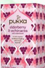
elderberry & echinacea 20 saszetek