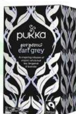
gorgeous earl grey 20 saszetek