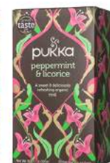
peppermint & licorice 20 saszetek