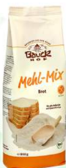
mix mąk do wypieku chleba bezglutenowy, bio