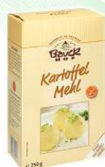
mąka ziemniaczana bezglutenowa, bio