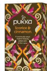
lukrecja & cynamon 20 saszetek