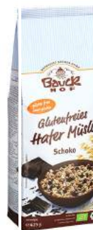
musli owsiane z czekoladą bezglutenowe, bio