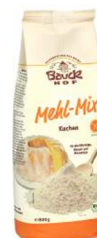
mix mąk do wypieku ciasta bezglutenowy, bio