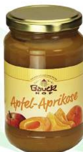
mus jabłkowo - morelowy bio