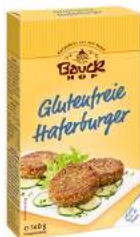
burger owsiany bezglutenowy, bio