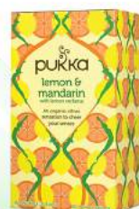
lemon & mandarin 20 saszetek