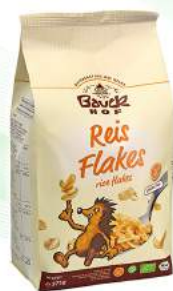
płatki ryżowe bezglutenowe, bio