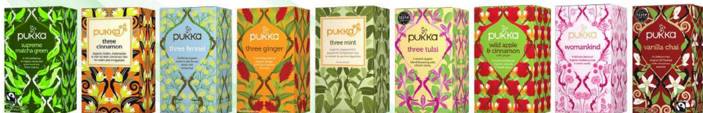
supreme matcha green 20 saszetek