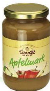
mus z jabłek bio