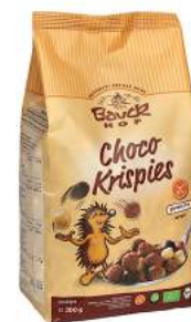
chrupiące kuleczki czekoladowe bezglutenowe, bio