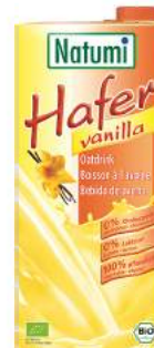
napój owsiany o smaku waniliowym