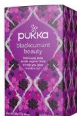
blackcurrant beauty 20 saszetek