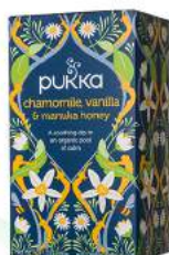
chamomile, vanilla & manuka honey 20 saszetek