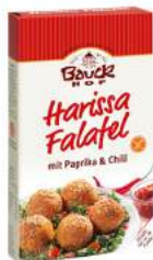
harissa falafa, burger bezglutenowy, bio