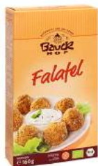
falafa, burger bezglutenowy, bio